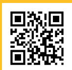
Opción impresora integrada.