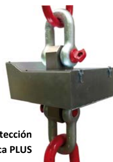
Protección anticalórica PLUS